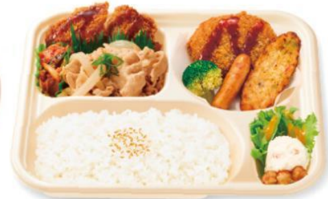
チキンかつ付 ねぎ塩豚カルビスペシャル 806円(税込870円)