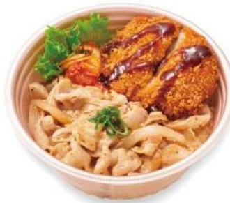
チキンかつ付 ねぎ塩豚カルビ丼 575円(税込620円)

「ヒーローは食べてかつ」のタイトルになぞらえキャンペーン対象商品は、チキン「かつ」付 ねぎ塩豚カルビシリーズ。ほっかほっか亭が誇る白ごはんの上に、店仕込みのチキンかつと人気のねぎ塩豚カルビをトッピング。箸休めのキムチにまでこだわった自慢の逸品です。また、カレーコロッケ、ウィンナー、お好み天、ブロッコリーが一緒の「ねぎ塩豚カルビスペシャル」も対象です。是非、この機会にご賞味ください。