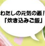
箱崎みどり アナウンサー