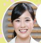
東島衣里 アナウンサー