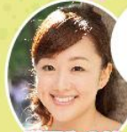
増田みのり アナウンサー