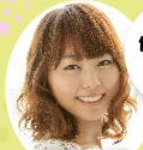
五戸美樹 アナウンサー