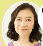
那須恵理子 アナウンサー